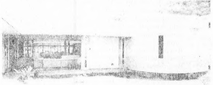
Doorkijkje vanuit de binnentuin.